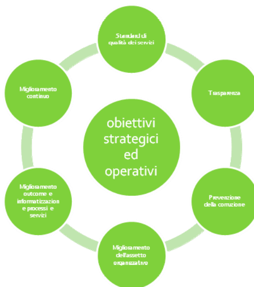
Figura 1: Gli indirizzi strategici nella valutazione della performance organizzativa

Come evidenziato in figura 1, gli obiettivi strategici e gli obiettivi operativi scaturiscono da indirizzi strategici fissati dal Rettore. Naturalmente, gli indirizzi sono strettamente correlati tra di loro e, quindi, il miglioramento nella performance di un indirizzo può incidere anche sulla performance di un altro.