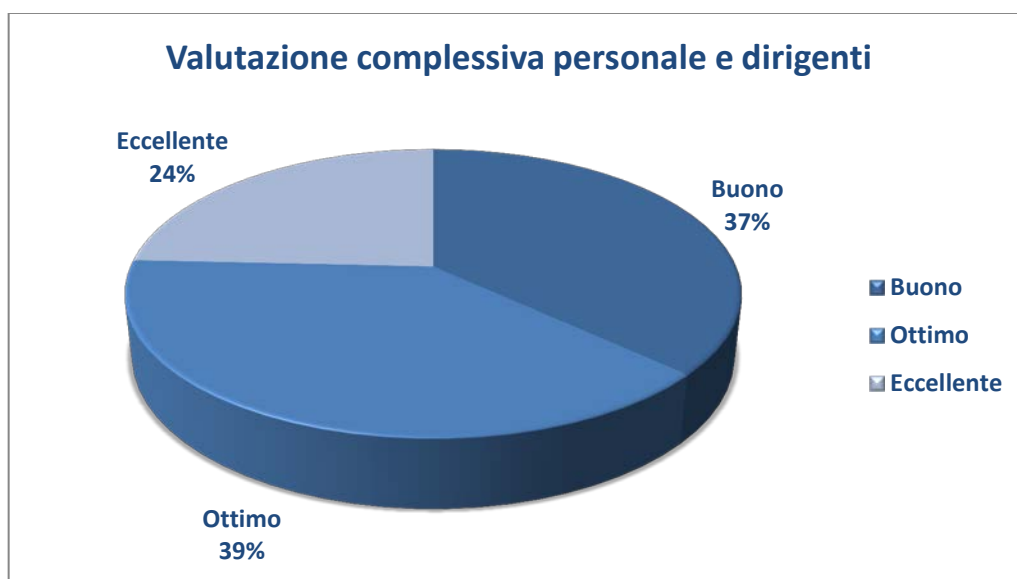
Tavola Personale Agenzia: fasce di valutazione Anno 2016 - Valutazione finale

Nella tavola seguente, è riprodotto un grafico che illustra la distribuzione del personale ACT, dirigente e delle aree funzionali, tra le diverse fasce di merito previste dal sistema di valutazione dell'Agenzia.