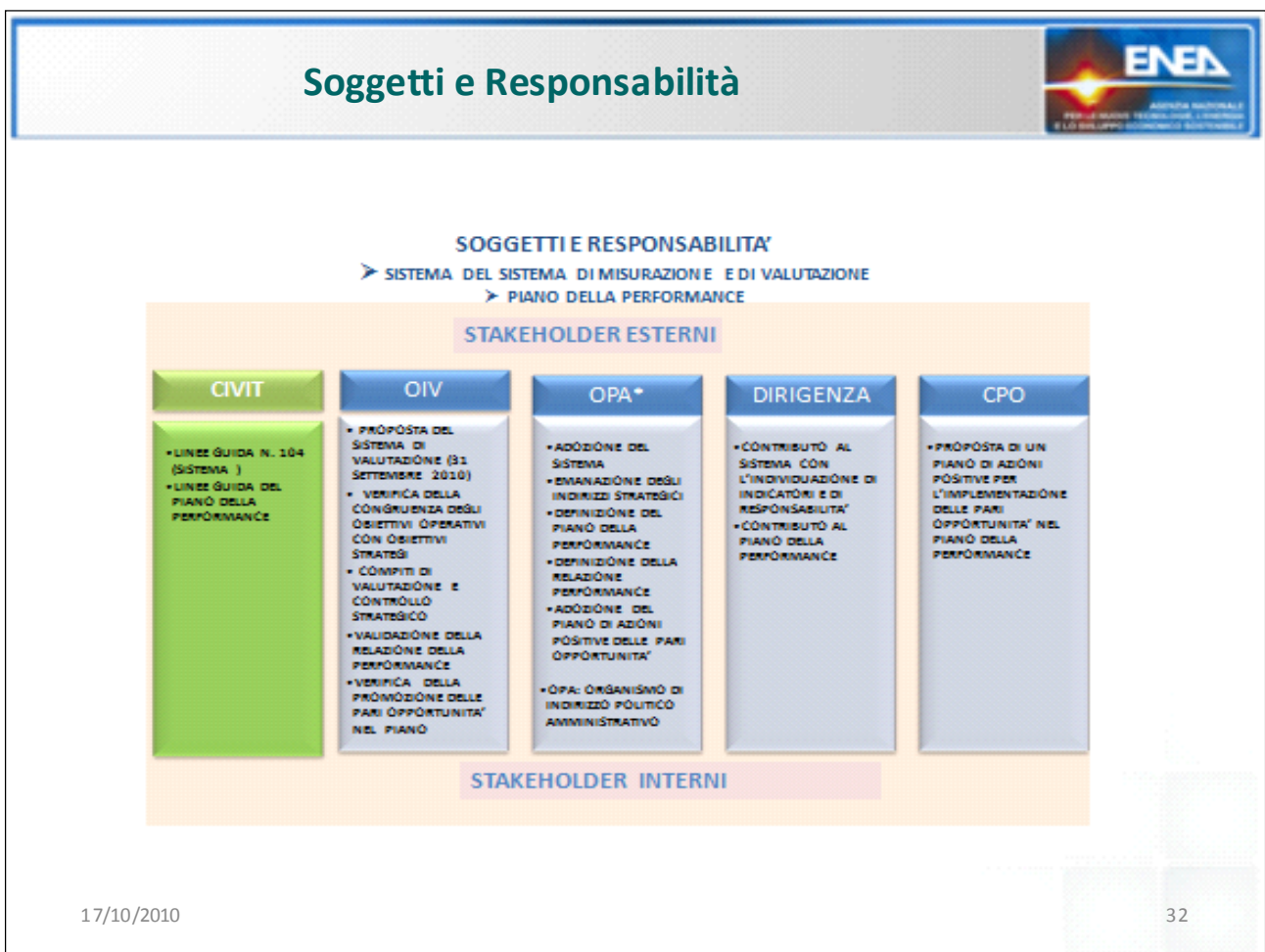
FIGURA 4: SOGGETTI E PIANO DELLA PERFORMANCE

I soggetti, con i rispettivi ruoli, che intervengono nel processo complessivo di misurazione e valutazione della performance organizzativa, individuale nonché in materia di trasparenza ed integrità sono riportati nelle figure sottostanti.