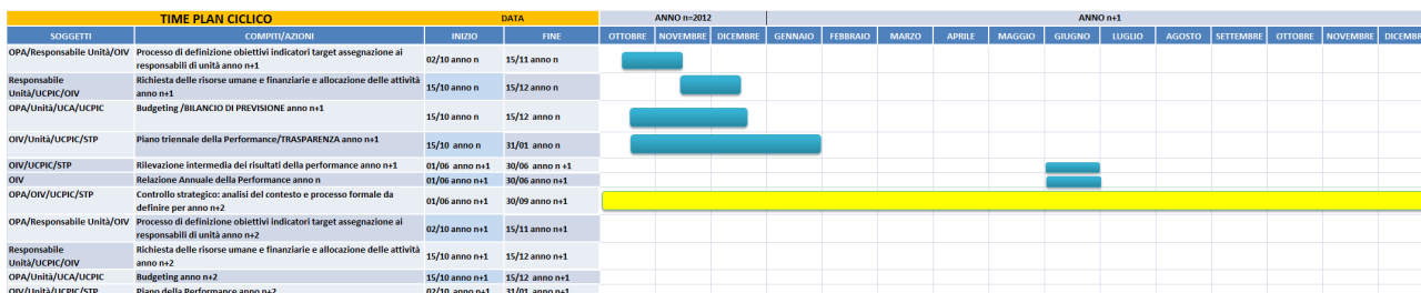
FIGURA 2: TIME-PLAN 2012-2013