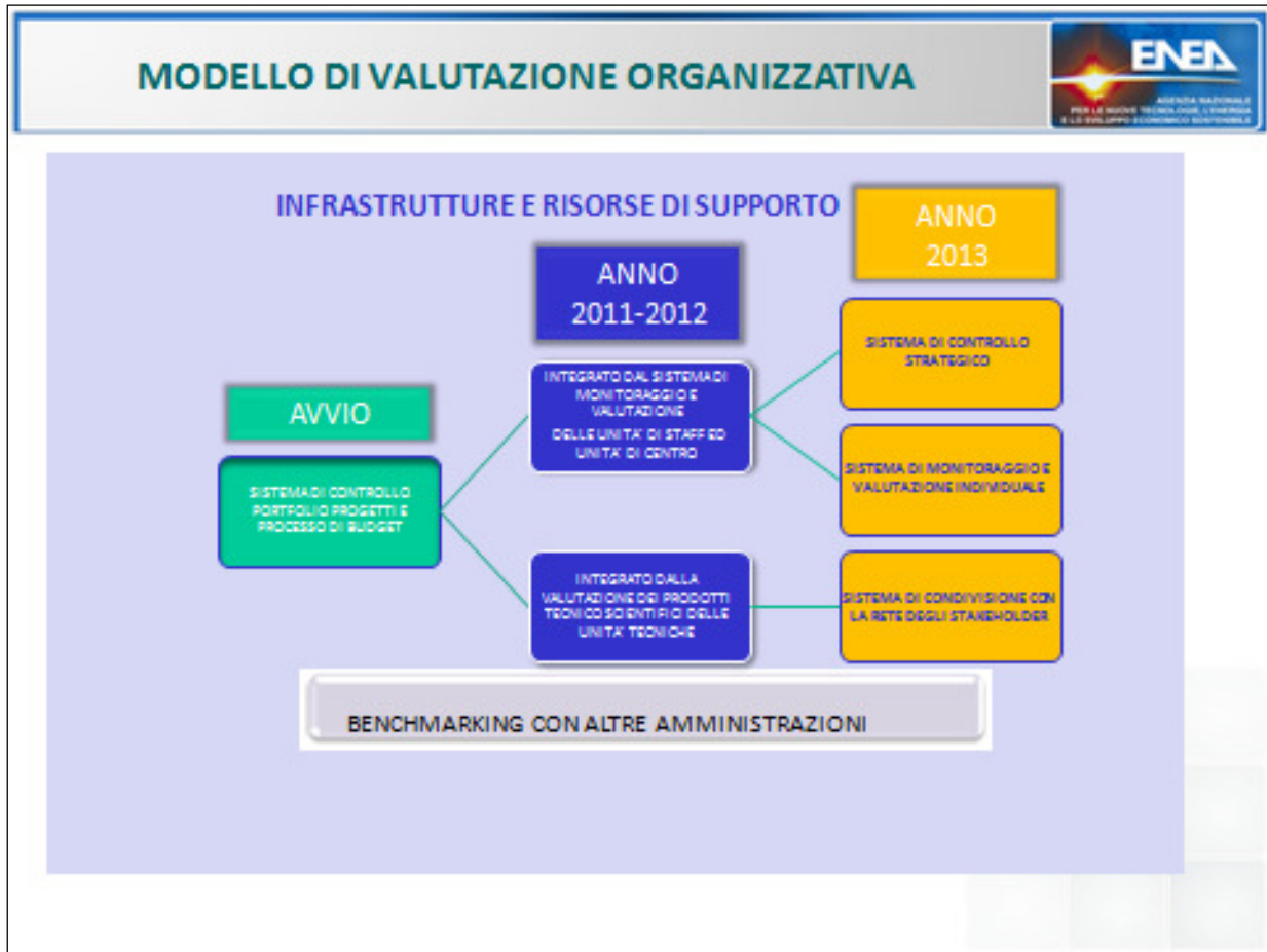
FIGURA 3: LE FASI DI IMPLEMENTAZIONE