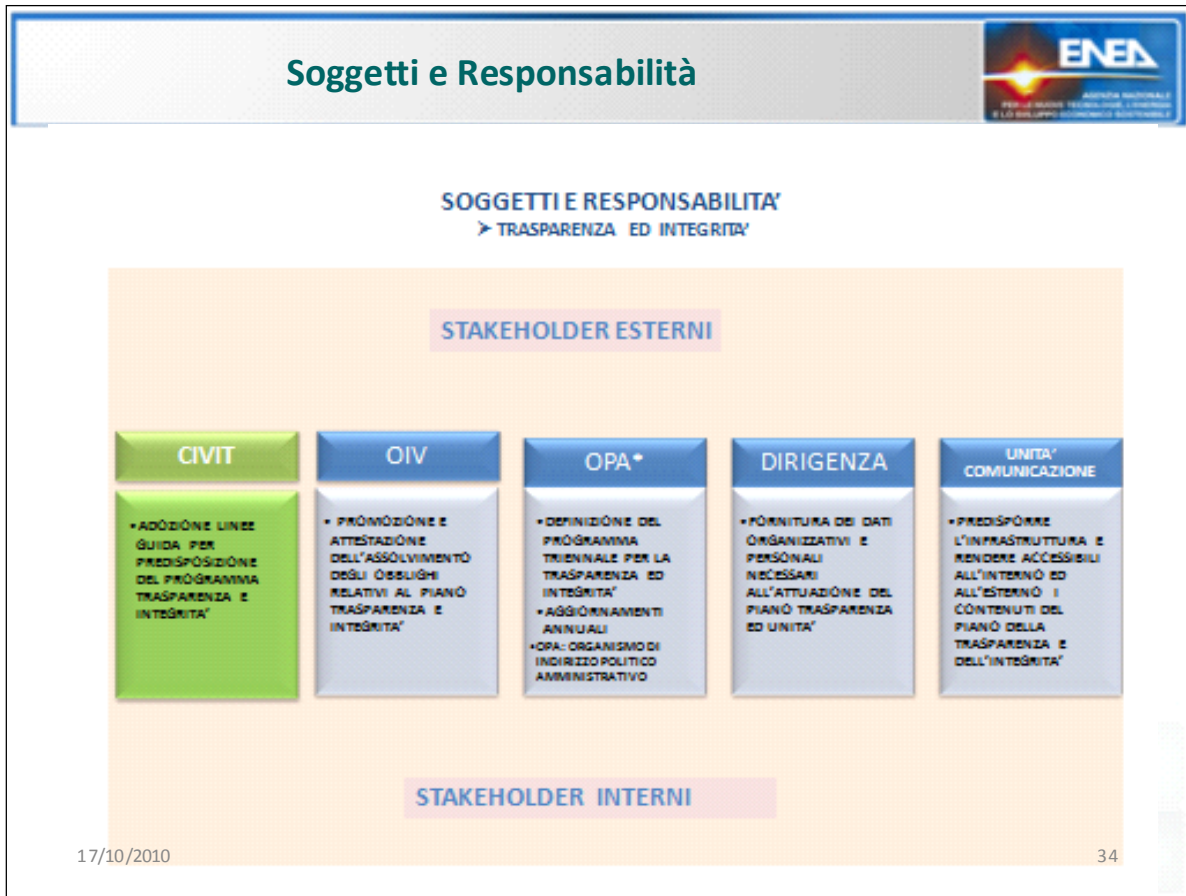
FIGURA 6: SOGGETTI, TRASPARENZA E INTEGRITA'